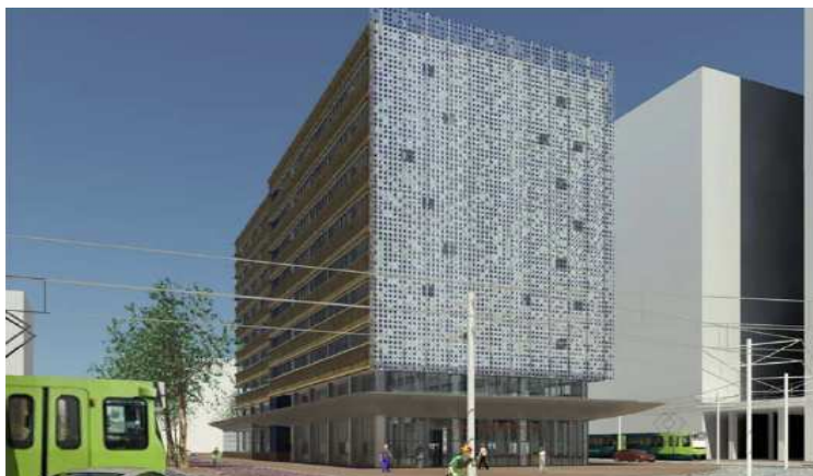
Impressie afwerking gevel gebouw Sijpesteijn

De gevel van het gebouw Sijpesteijn wordt afgewerkt met zonnepanelen. De begane grond en de eerste verdieping worden opengewerkt met glas.