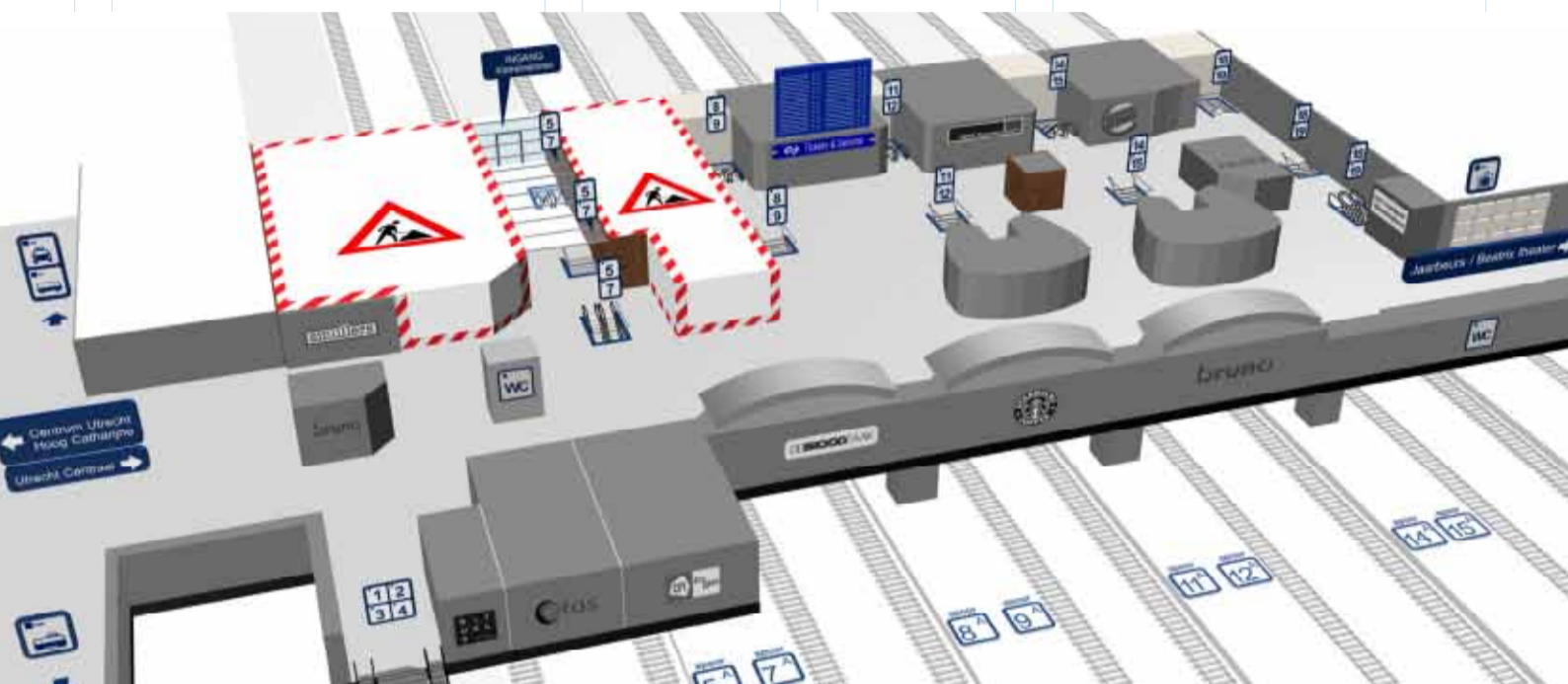
Overzicht stationshal utrecht Centraal vanaf derde kwartaal 2011

Een kijkje achter de (bouw)schermen pagina 8