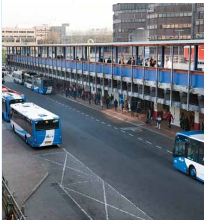
Looproute van en naar het station via het voormalig taxiplateau

Het werk aan de perrons duurt tot halverwege 2014. Een belangrijk gevolg hiervan is dat de Noorderfietsenstalling onder de sporen dicht gaat. Deze ruimte is nodig voor