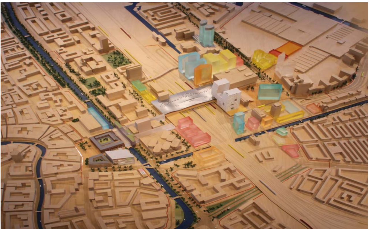
Nieuwe gebouwen in het Stationsgebied, op de maquette in het Infocentrum

Victor Everhardt, Wethouder Stationsgebied