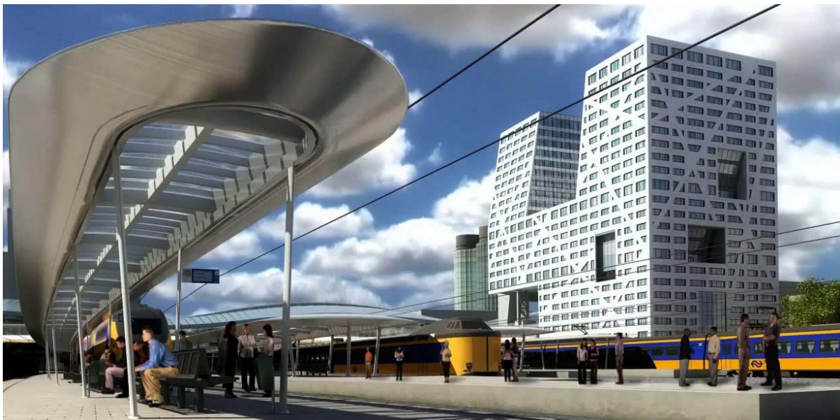
OV-terminal, Stadskantoor en Rabobank in één beeld

Terwijl bij de UCP plannen uitgebreide beeldkwaliteitsboeken zijn gemaakt, heeft het college daar bij de plannen voor het Stationsgebied van afgezien.