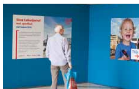
in de Jaarbeustraverse