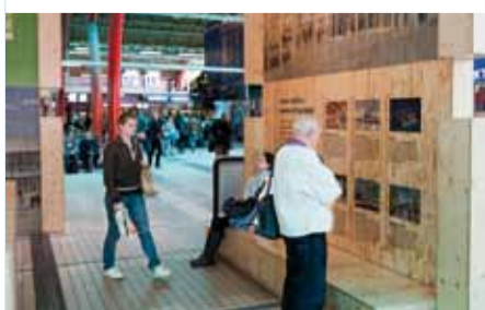
in de i-Bouw

Op steeds meer plekken in en rond het station kunnen reizigers zich informeren over de (aanstaande) verbouwing: