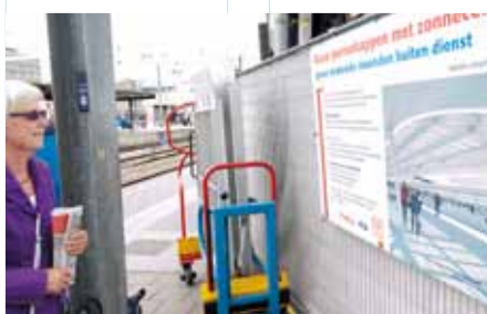
op de perrons